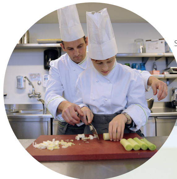
S'épanouir dans la vie professionnelle malgré le handicap

Pour assurer un bon règlement de votre succession (inventaire des biens et des dettes, paiement de ces dernières et de l'impôt de succession, répartition des actifs entre les héritiers.ères, etc.), vous pouvez désigner dans votre testament un « exécuteur.trice testamentaire », qui sera responsable de l'exécution de vos dernières volontés.