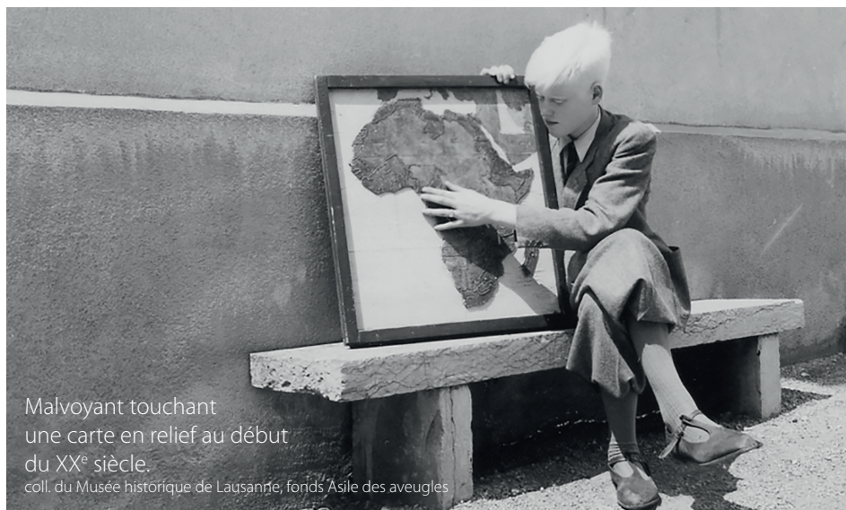
Malvoyant touchant une carte en relief au début du XX e siècle.

La Fondation évolue et s'adapte aux époques qu'elle traverse sans jamais perdre de vue son objectif initial : faire reculer la cécité dans le monde . Nos plus de 600 collaborateurs.trices se mobilisent ainsi chaque jour au service de la santé visuelle.