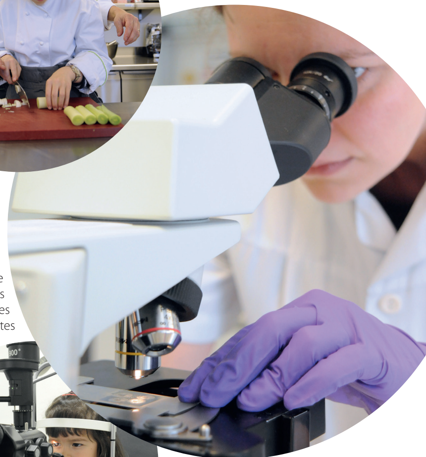
Un centre de recherche pour des nouvelles stratégies thérapeutiques innovantes