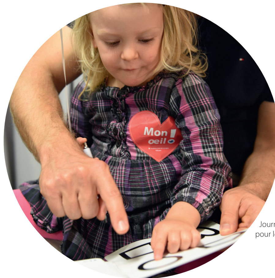
Journée de dépistage pour les enfants